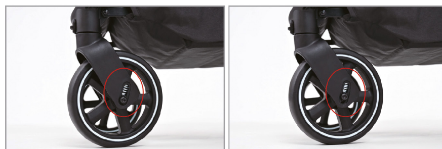
Передние колеса с функцией подвески.