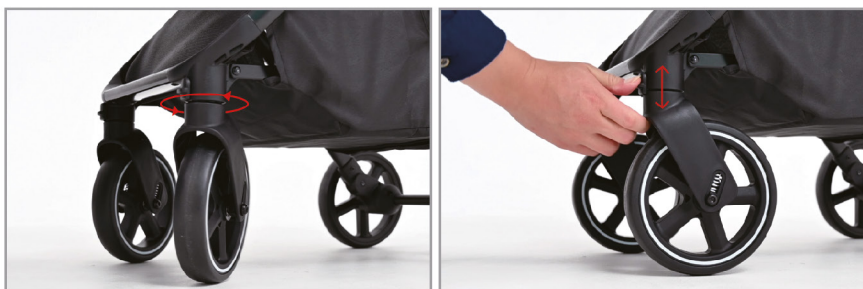
Переднее колесо поворачивается на 360 градусов для удобства использования, кнопка направления опускается для блокировки и поднимается для поворота в универсальное направление.