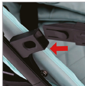
Вставьте обе стороны одновременно.