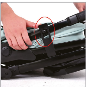
Откройте складной замок.