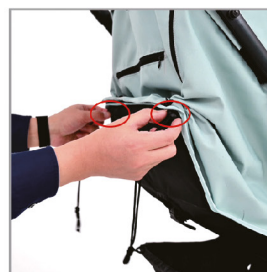
Найдите пряжку на спинке.