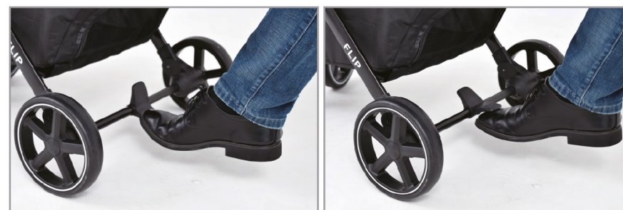
Двойное управление одной ногой, нажмите на тормоз, поднимите его и поезжайте