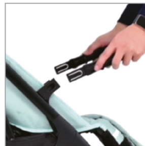
Вставьте подлокотник с обеих сторон держателя подлокотника.