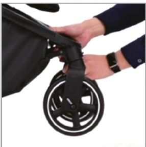
Установлены два передних колеса.