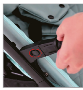
Когда услышите звук "щелчка" установка завершена.