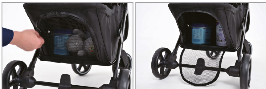
Корзина с застежкой-молнией для удобного хранения.