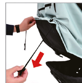
Опустите две пряжки.