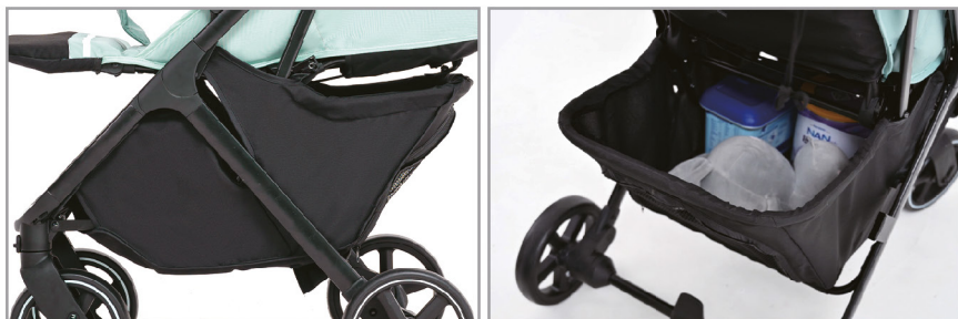
Большая корзина для хранения