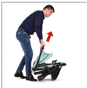
Потяните вверх, чтобы открыть корпус коляски.