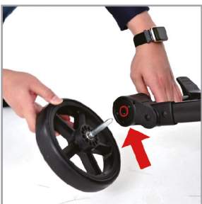
Вставьте ось в отверстие держателя заднего колеса.