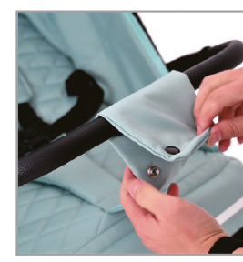
Промежный ремень проходит через подлокотник.