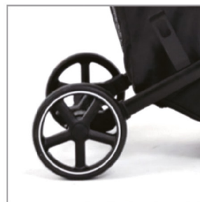
Установлены два задних колеса.