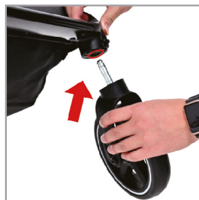
Вставьте переднюю ось в отверстие держателя переднего колеса.