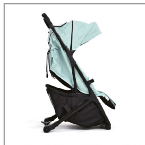
Разверните корпус коляски