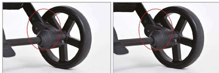
Задние колеса с функцией подвески.